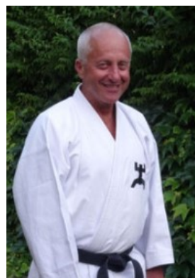
6. Dan Goju-ryu