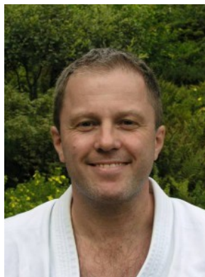
7. Dan Shito-ryu