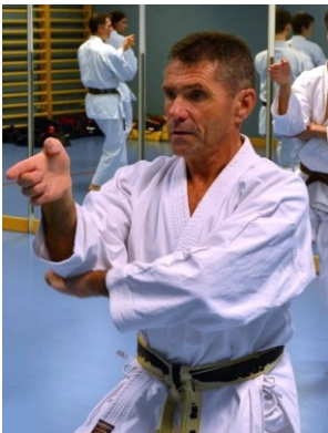
7. Dan Shotokan-ryu